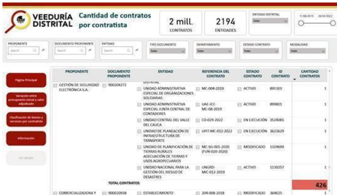
Figura 4. Diagrama de cantidad de contratos por contratista